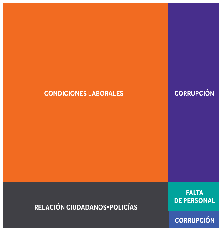
Fuente: Treemap desarrollado por el autor con información de la Base de Datos de Policías entrevistados 2015-2020 de World Justice Project, anonimizada. Referencias agregadas por código.

Entre 2015 y 2020 el World Justice Project (WJP) entrevistó a policías mexicanos que desempeñan funciones de investigación, prevención y reacción en los tres órdenes de gobierno, incluyendo policías en Escobedo. En esos procesos de investigación empírica, los mismos policías son quienes dan respuesta a cómo mejorar el desempeño policial. La siguiente tabla muestra los aspectos a los que hacen mayor referencia las y los policías mexicanos al identificar los principales problemas de sus instituciones. Los tres principales desafíos identificados por las policías son las condiciones laborales, la corrupción y la relación con la ciudadanía.